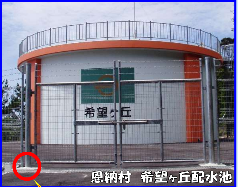
恩納村 希望ヶ丘配水池