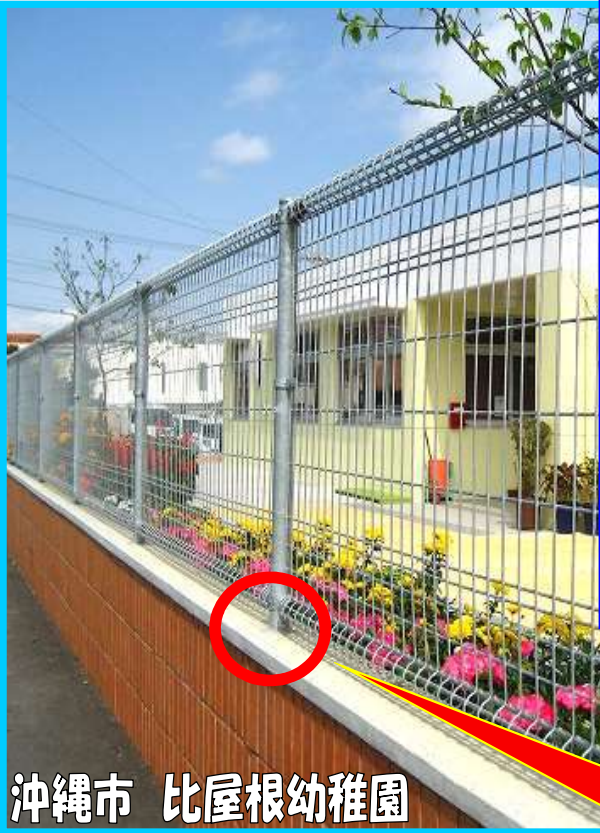
沖縄市 比屋根幼稚園

溶接金網、鋼管、溶融亜鉛めっき等の製造技術を用いて、腐食による柱倒壊の原因である柱内の水分を排出させる特許構造を施し、塩害に強いフェンスの製造を行っています。